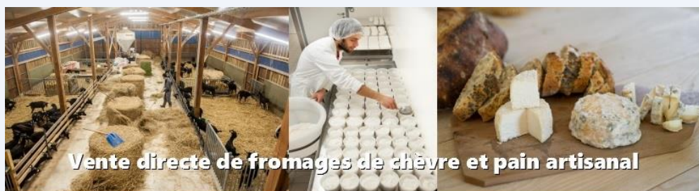
Vente directe de fromages de chèvre et pain artisanal

Tous participent à la commercialisation qui se fait sur les marchés, à la ferme, dans des épiceries et via des groupements de consommateurs. Tous sont polyvalents, ce qui permet de mieux organiser les congés et les week-end.